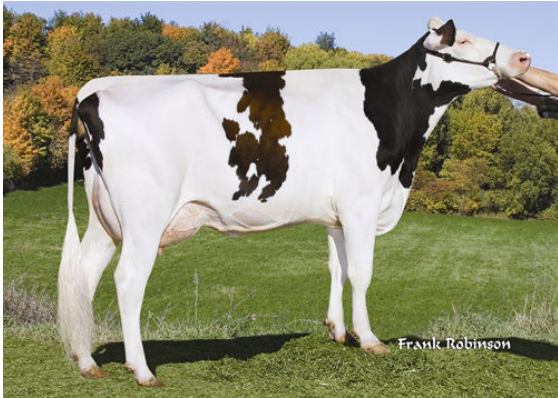
KHW-I AIKIA BAXTER DAM